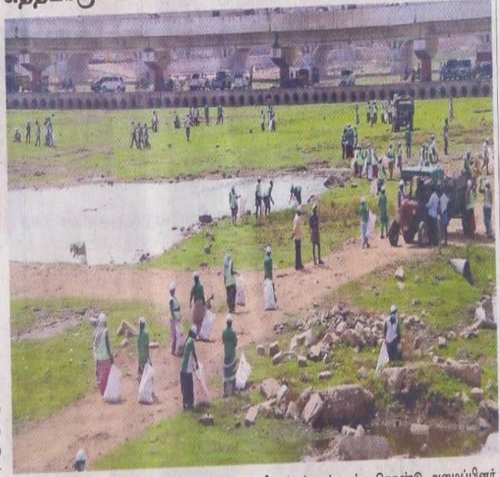
► மதுரை வைகை ஆற்றுப்பகுதியை மாநகராட்சி மற்றும் தன்னார்வ தொண்டு அமைப்பினர் சுத்தப்படுத்தும் பணியில் ஈடுபட்டனர்.