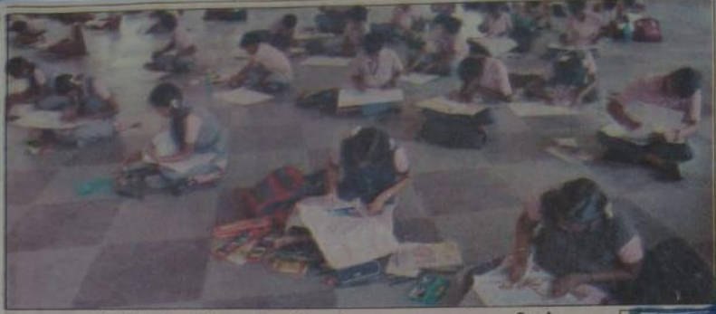
ஓவியப்போட்டியில் கலந்து கொண்ட மாணவ, மாணவிகள்.