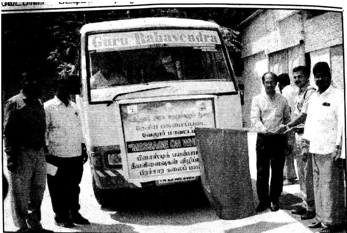
வேலூர் மாவட்ட தேசிய பசுமைப் படை சார்பில் நாராயணி மெட்ரிக் மேல்நிலைப்பள்ளியில் பிளாஸ்டிக் மாசில்லா விழிப்புணர்வு பயணம் தொடங்கப்பட்ட காட்சி.