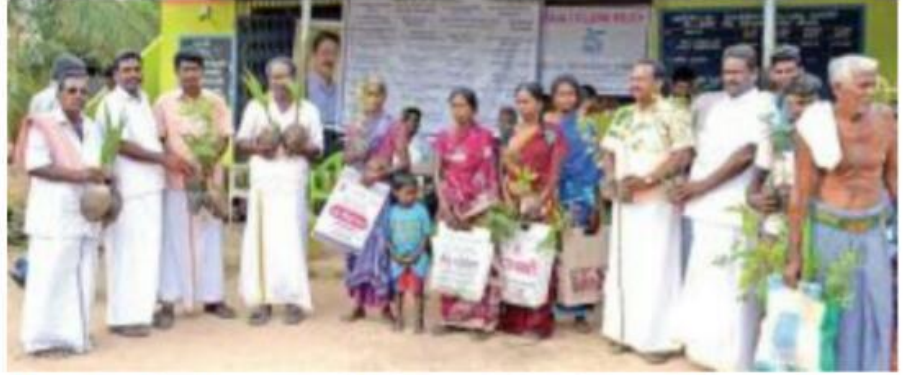
▲ கஜா புயலால் பாதிக்கப்பட்ட நெடுவாசல் பகுதியில் தேசிய கடல்சார் தொழில்நுட்ப நிறுவனம் சார்பில் விவசாயிகளுக்கு வழங்கப்பட்ட தென்னங்கன்றுகள்.

இந்நிறுவனம் கடல், அலை, காற்று, புயல் தொடர்பாக ஆய்வு செய்கிறது. அதனால் எங்கள் நிறுவன விஞ்ஞானிகள் 5 பேர் கொண்ட குழு புயல் பாதித்த டெல்லா மாவட்ட கிராமங்களை பார்வையிட்டது. அப்போது 82 வயது முதாட்டி, 63 வயது மகள் ஆகியோர்கொண்ட குடும்பம் ஒன்று