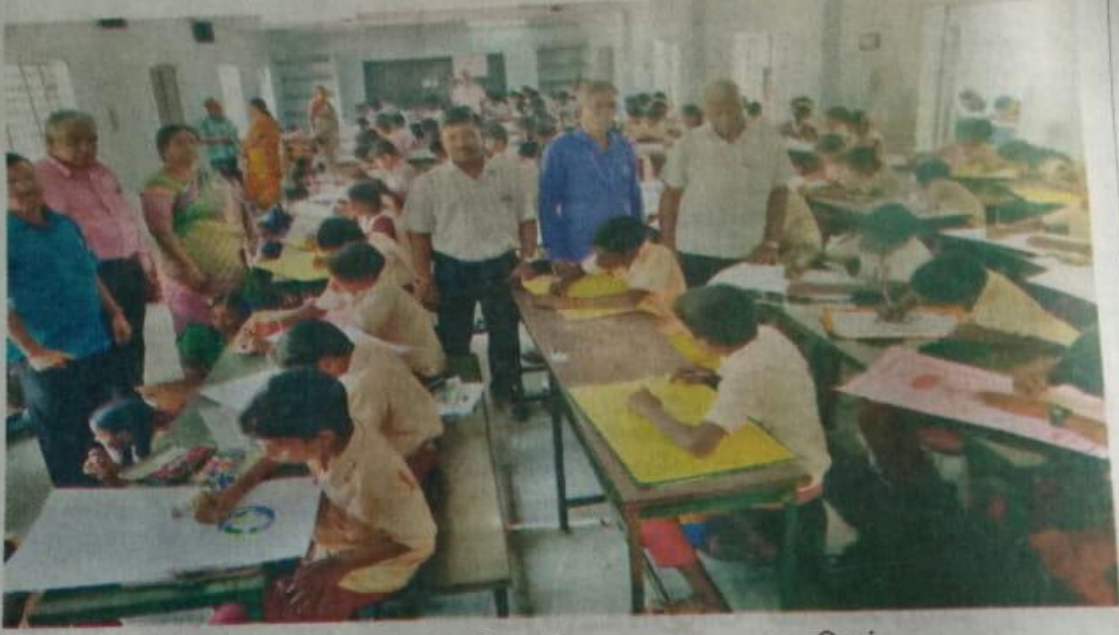
போட்டியில் கலந்து கொண்ட மாணவ,மாணவிகள்.

அரியலூர், பிப். 8: அரியலூர் அரசு மேல்நிலைப் பள்ளியில் மாணவ, மாணவிகளுக்குான மாவட்ட அளவிலான நடைபெற்ற சுற்றுச்சூழல் விழிப்புணர்வு போட்டிகள் வெள்ளிக்கிழமை நடந்தன.