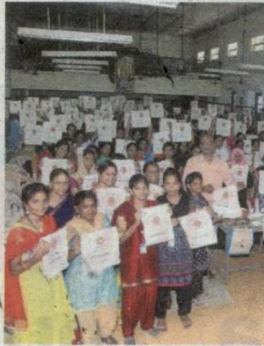
During the awareness session at Quaid-e-Millath Government College for Women.

As part of the initiative, 300 cloth bags sponsored by IOC were distributed.