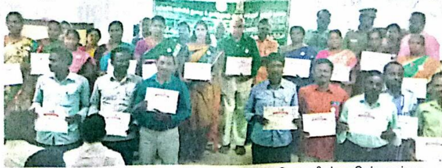
நடப்பு கல்வி ஆண்டில் தேசிய பசுமைப்படையின் செயல்பாடுகளை சிறப்பாக செய்தமைக்காக பாராட்டுச் சான்றிதழ் பெற்ற ஆசிரிய,ஆசிரியைகள்.

வீடுகளில் நவீன சாதனங்களின் பயன்பாடு மற்றும் இருசக்கர வாகனம், நாங்கு சக்கர வாகனங்களின் பயன்பாடும் பொதுமக்களிடையே அதிகரித்துள்ளது. இதன் மூலம் வெளிப்படும் கார்பன் காரணமாக சுற்றுச்சூழல் மற்றும் வளிமண்டலம் பாதிப்படைகிறது. இயற்கை மாசுபடுவதன் காரண