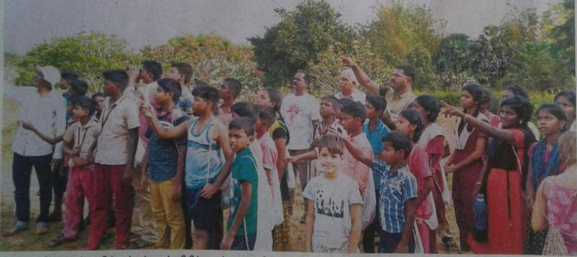
▲ தாவரவியல் பூங்காவில் சுற்றுச்சூழல் விழிப்புணர்வு முகாமில் பங்கேற்ற அரசு பள்ளி மாணவர்கள்.

இம்முகாமில் வானூர் அருகே டி.பரங்கனி, மொரட்டாண்டி நடுநிலைப்பள்ளியில் பயிலும் மாணவ மாணவிகள் மற்றும் புதுச்சேரி எல்லைப்பிள்ளைச்சாவடி மாணவர்கள் மற்றும் அரியலூர் மாவட்டம் தேவமங்கலம் அரசு பள்ளி மாணவர்கள் கலந்து கொண்டனர்.