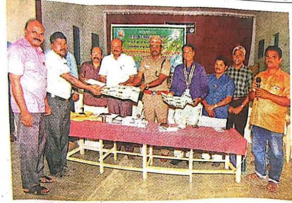
தூத்துக்குடி மாவட்ட தேசிய பசுமைப்படை பள்ளிகளுக்கு செயல்பாட்டு நிதி வழங்கப்பட்டது.